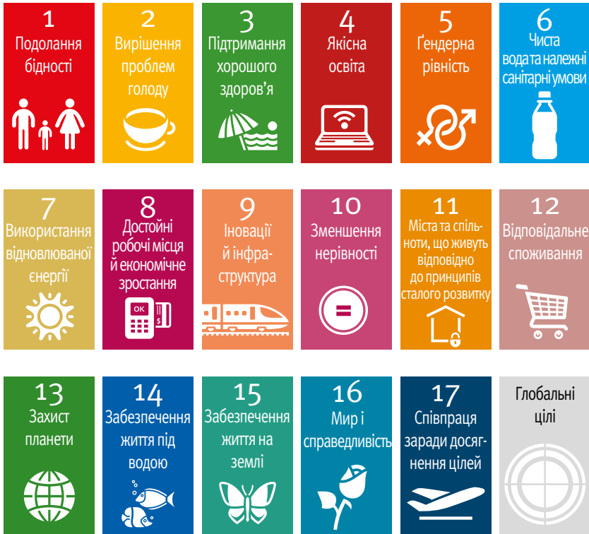
Рис. Цілі сталого розвитку 14

Перелік цілей сталого розвитку (ЦСР) був офіційно затверджений на засіданнях Генеральної Асамблеї ООН в кінці вересня 2015 року 13 . Цілі сталого розвитку (ЦСР), яких на сьогодні дотримуються всі країни світу, встановлюють власні показники розвитку і включають 17 цілей і 169 конкретних завдань.