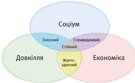
Рис. Концепція сталого розвитку 11

Концепція сталого розвитку з'явилася в результаті об'єднання трьох основних точок зору: економічної, соціальної та екологічної.