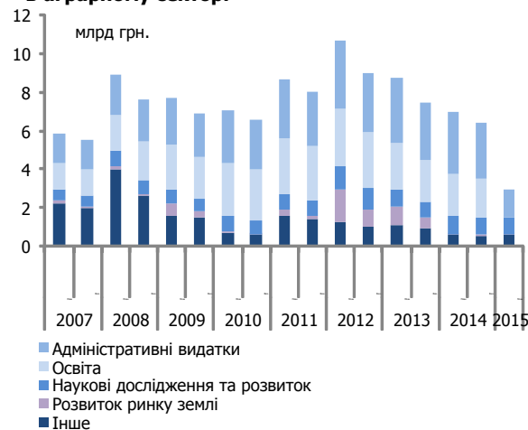
Рис. 3. Заходи, що стимулюють зростання в аграрному секторі