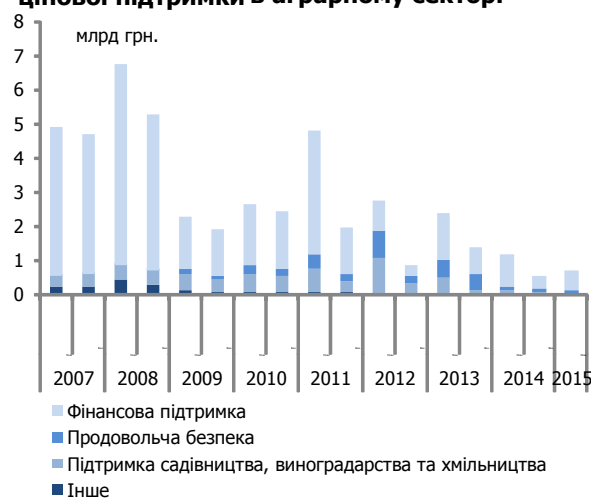
Рис. 2. Виробничі субсидії та заходи цінової підтримки в аграрному секторі